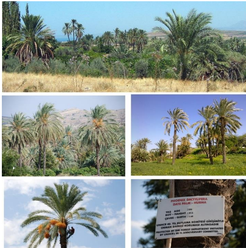
Şekil 3. Lefke bölgesi çalışma alanında doğal ortamlarında bulunan hurma bahçeleri ve ağaçlarından oluşan görüntü

Araştırmada bitki materyali olarak kullanılacak hurma genotiplerinin belirlenmesi amacıyla Lefke ilçe merkezde yer alan tarım ilçe müdürlüğü ile hurma hakkında iyi bilgiye sahip olan bölgedeki hurmalarla yıllarca ilgilenmiş Lefke bölgesi sakini olan ve bu işi tek başına yürüten "Hurmacı Savaş" olarak tanınan kişi ve bölge halkından hurmalar hakkında miktarları ve nerelerde daha yoğun oldukları hakkında bilgiler edinilmiştir. Edinilen bilgiler ışığında hurma yetişen ve/veya yetiştirilen bölgeler sınıflandırılmış ve bu sınıflandırmalar doğrultusunda ilk olarak Lefke bölgesinin en uç kısmını oluşturan Aplıç bölgesinde (Kıbrıs Rum kesimi ile K.K.T.C sınırının keşişen bölgesi) hurma sayımlarına başlanılmıştır. Bu bölgedeki hurma sahipleriyle birebir görüşmeler yapılmış ve hurma sayıları, erkek ve dişi olmak üzere bilgiler alınmıştır. Daha sonra bu hurmalar erkek ve dişi ağaçlar şeklinde sayımları yapılmış ve yerleri tespit edilerek etiketlenmiştir (Şekil 3). Aynı şekilde diğer bölgelerdeki çalışmalar da bu şekilde yürütülmüştür.