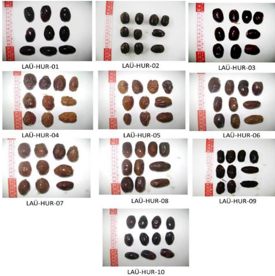
Şekil 4. Bazı genotiplerinin meyvelerinin görüntüleri

Pomolojik analizleri yapılan ve farklı olarak bulunan genotiplerin meyvelerine ait resimler Şekil 4'te verilmiştir.