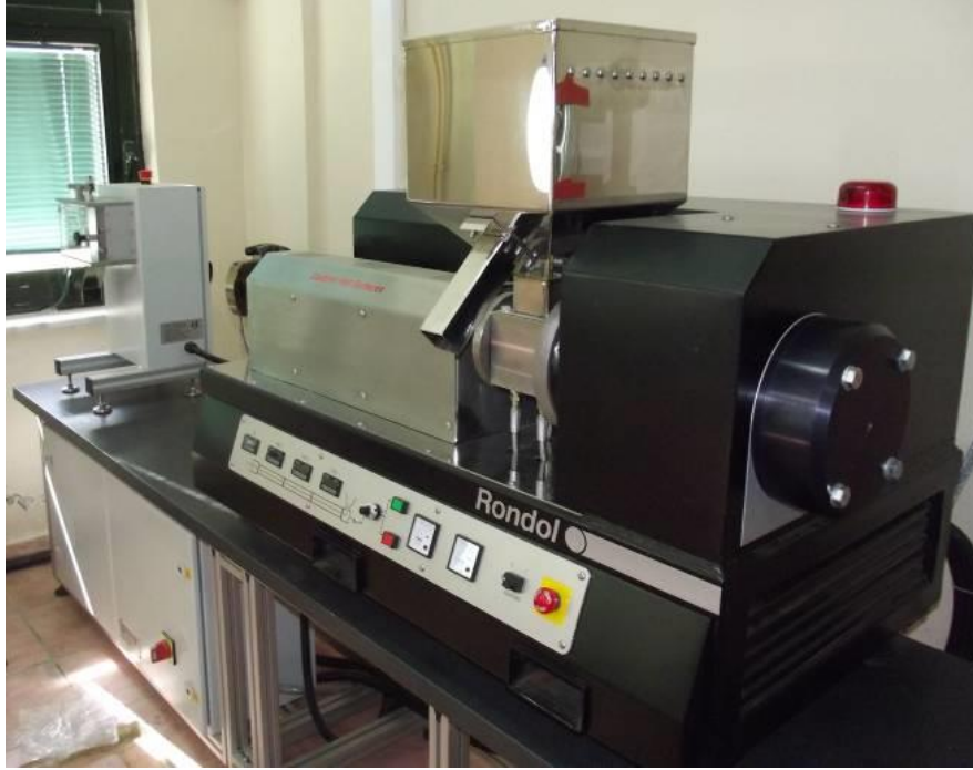
Şekil 2: Ekstruder Makinesi

getirilmiştir. Peletler, 180 °C'ye kadar ısıtılmış sıcak pres içerisinde levha haline getirilmiştir. Şekil 2'te Rondol marka ekstruder makinesi görülmektedir.